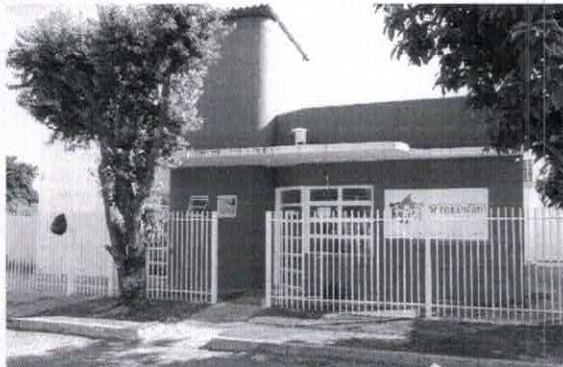
Registro de Localização.